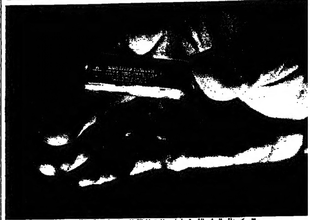
كبسولة الرماح، التي تحمل اسم الميت اضافة الى رمز ديني يمثل طائفته